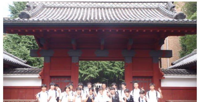
<東大・京大訪問研修：東京大学赤門前にて>

理数系の教科に重点を置いたカリキュラムで、ハイレベルな授業を展開し、難関大学・医学部への進学者も多くいます。課題研究等独自の研修や行事があり、科学技術コンテストなどにも参加します。