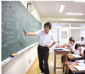
<習熟度別授業：数学>

2年次から文系・理系に分かれます。大学セミナーや先端科学技術体験学習をとおして、自分の適性を見極めることができます。教科により習熟度別授業があり、個人の能力を最大限に伸ばせます。